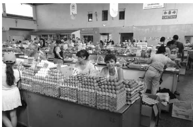
V mukačevské tržnici

a veřejné moci je značná. Optimalizace daní je běžná všude, nechť platit daně na Ukrajině je však extrémní. Leckdo zastává názor, že přece nebude platit těm lapkům nahoře. Že se z toho beztak hodně „ztratí“. Výsledkem je poměrně hubený státní rozpočet. Podle webové stránky cost.ua/budget dosahují schválené výdaje státního rozpočtu Ukrajiny na rok 2019 na obyvatele zhruba 27 tisíc hřiven. Výdaje penzijního fondu jsou schváleny zhruba 9,5 tis. hřiven na obyvatele Ukrajiny. Rozpočet počítá s poměrně velkým deficitem a příjmy jsou zhruba 24,7 tisíce hřiven na obyvatele (1 hřivna je podle kurzu necelá 1 Kč). Pro porovnání uvedme, že výdaje státního rozpočtu ČR za rok 2018 činily podle monitor.statnipokladna.cz bezmála 132 tisíc Kč na obyvatele. Ani v jednom případě nezapočítávám výdaje místních samospráv. Celý ukrajinský stát je tak v začarovaném kruhu. Lidé, pokud to jen trochu jde, neplatí daně. S tím, že se stejně ztratí (rozkradou). Stát má tak relativně málo na své výdaje. Nejen proto, že něco se jistě ztratí (stačí si přečíst v knize Milana Syručka „Rusko-ukrajinské vztahy: mýty a skutečnost“, s jakými zavazadly evakovali Rusové ukrajinského prezidenta Janukoviče