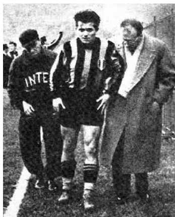
Ivan Něrš alias Istvan Nyers v posledním roce svého působení ve slavném dresu milánského Interu.