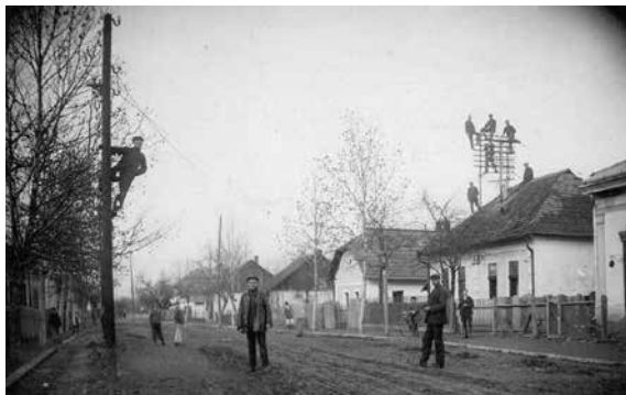
Montáž telefonního vedení ve Velkém Berezném – 1933