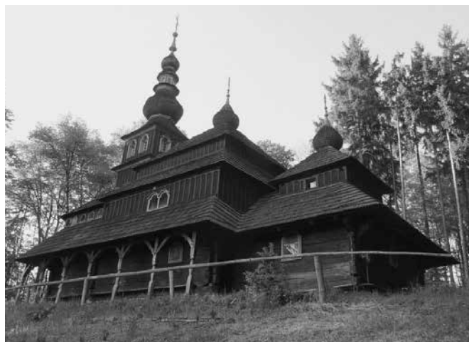
Kostel v Nové Pace