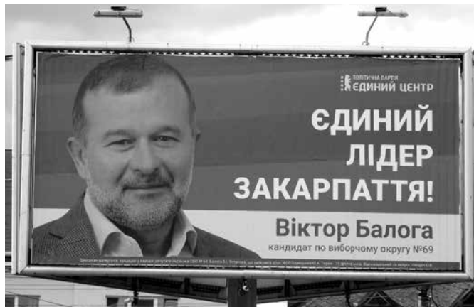
Volební kampaň na Podkarpatsku 2019

Ukrajina bývá označována jako „hybridní demokracie“. V takových státech leccos s demokratických principů drhne. Oblíbeným sportem