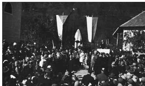
Slavnostní odhalení Masarykovy sochy v Rachově