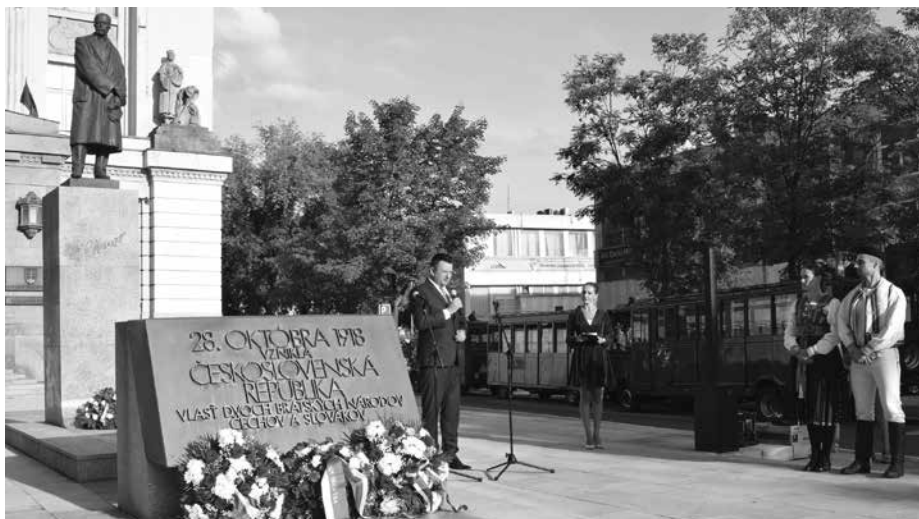
Vystoupení velvyslance České republiky Tomáše Tuhého