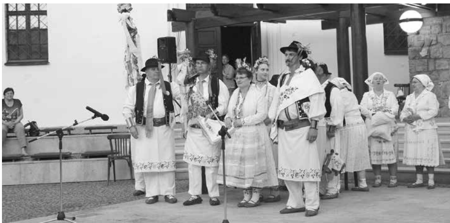
Skejušan na svatbě v Uherským Brodě