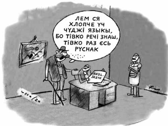
„Jen se chlapče uč cizí jazyky, protože kolik řečí umíš, tolikrát jsi Rusínem.“