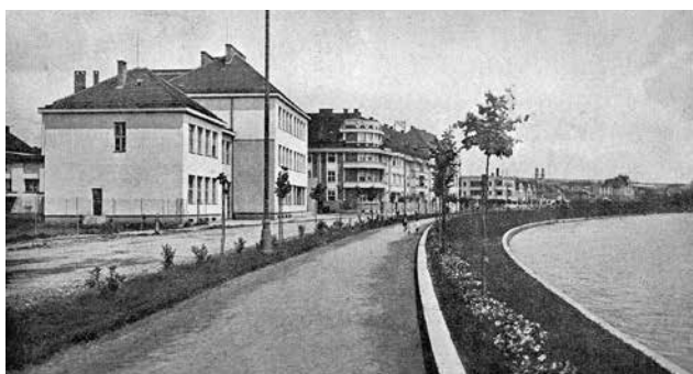
Mladé lípy na Tyršově náměstí u školy T. G. Masaryka – r. 1935

Nelze pominout, že při okrašlovacích snahách v podkarpatských městech, zřizování parčíků, vysazování stromů a živých plotů, apod. se vyskytovaly i některé potíže. Třeba volné pobíhání dobytka v menších městech, když se každý den hnal městem dobytek