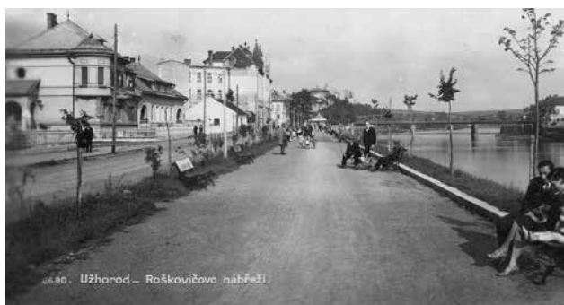
Budoucí lipová alej na Roškovičově náměstí – stav v r. 1932

ží blíže k centru města. Na podzim 1934 pak okrašlovací spolek zabezpečil vysazení 18 lip na Tyršově nábřeží opačným směrem – k později vybudovanému Masarykovu mostu.