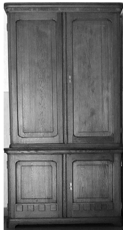
Knihovnická skříň z roku 1902

Obecně se ve zprávě zmiňuje pozitivní postoj školského referátu Podkarpatské Rusi