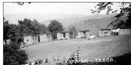
Chatky sokolského tábora

Pro svou blízkost k Užhorodu a malebnou polohu na svahu nad řekou Uže v sytém zelení bukových lesů se hrad Nevické stal oblíbeným dostaveníčkem užhorodského obyvatelstva. Chodilo se také na vycházky na hory v okolí – na Plišku, Antalovskou Poljanu, Vajdovu Louku, Sinatorii. Ten, kdo to zažil, nezapomene na krásu horské krajiny, lučin a pastvin. Ty tisíce konvalinek a petrklíčů na Zarubaně Kyčeře a všechno ostatní! Oblíbené byly i Onokovské údolí a Drinodil jen kousek od dráhy – cesta tam byla méně namáhavá.