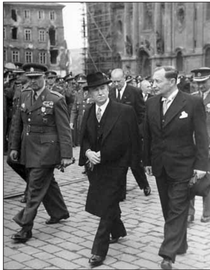
Edvard Beneš a Zdeněk Fierlinger, 1946

šení o tom, že připojení „Zakarpatské Ukrajiny“ (prezident upravil k obrazu svého „nejvěrnějšího spojení“ i svůj slovník) k SSSR považuje za samozřejmé, a zároveň opakoval, že bude provedeno až po projednání s domácími politickými činiteli. E. Beneš svým do-