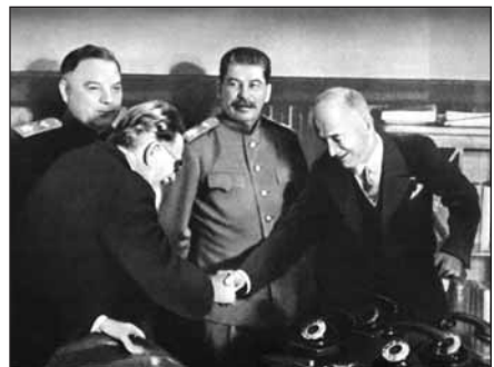
Edvard Beneš v Moskvě

Stalinovi se však pozice čs. vlády a prezidenta v otázce Podkarpatské Rusi zdála být váhavou a nedůslednou. Proto se rozhodl zásáhnout do problému osobně. Dal se informovat K. Gottwaldem o názorech čs. vlády v případě Podkarpatské Rusi. Pozvání Gottwalda, z hlediska diplomatického protokolu soukromé osoby, nebylo náhodné. Přitom během celé války Stalin nevěnoval žádnou pozornost čs. komunistům. Pozváním Gottwalda sovětský diktátor chtěl upozornit Beneše, že má v záloze i jiného československého lídra. 23. ledna 1945 pak poslal Stalin Benešovi varovný dopis, v němž vyslovil údiv nad zkrácenou představou československé vlády a prezidenta o pozici SSSR v otázce Zakarpatské Ukrajiny. Opakoval známou tezi svých diplomatů, že SSSR nemohl zakazovat tamním obyvatelům, aby vyjádřili svou „národní vůli“. Zároveň připomněl Benešovi jeho ochotu odevzdat Podkarpatskou Rus SSSR, vyslovenou přímo jemu, Stalinovi. Na závěr Beneš ujistil, že sovětská vláda nemá v úmyslu jakkoliv poškodit zájmy Československa a jeho prestiž.