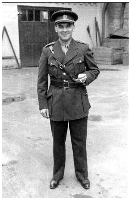
Generál Heliodor Píka

Za svého pobytu v Moskvě ve dnech 21.–24. března 1945 potvrdil prezident Beneš ještě jednou písemně svou ochotu odevzdat Podkarpatskou Rus SSSR. V rozhovorech