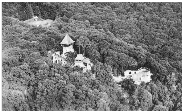
Letecký pohled na hrad Nevické