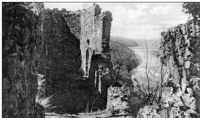
Pohled z hradu Nevické do údolí Uže

Vesnice Nevické leží ve střední části údolí řeky Uže, přibližně 10 km od Užhorodu. Nepřímé zprávy o vesnici jsou od druhé poloviny 13. století, kdy se datuje první zmínka o stejnojmenném hradu. V daňovém soupisu z roku 1427 je uvedeno 18 usedlostí. Koncem 16. století bylo Nevické středně velkou vesnicí, nacházelo se zde 30 obydlí karpatských domů. Pravděpodobně od 15. století stál ve vesnici kostel, zprávy o něm jsou však až z druhé poloviny 18. století, kdy zde působili řeckokatoličtí kněží. Nevické si dlouhá staletí zachovávalo ráz rusínské vesnice.