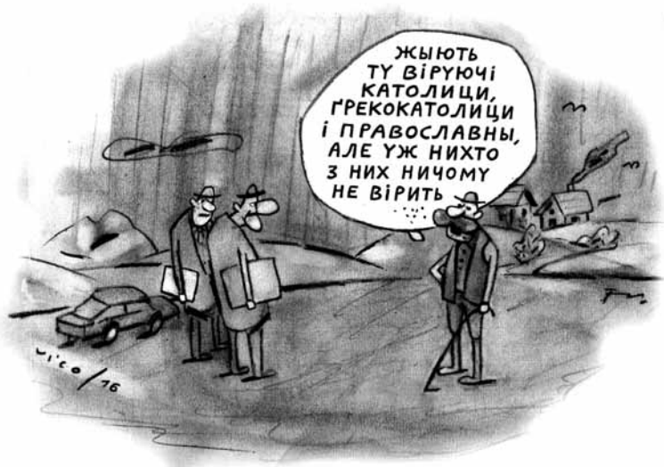
Žijí tady věřící katolíci, řeckokatolíci i pravoslavní, ale nikdo z nich už ničemu nevěří.

Pořad stojí za poslech i pro rozhovory, informace a zajímavosti věnované ostatním menšinám, jejich osobnostem, kultuře, umělcům, uměleckým dílům a společenskému životu. Redaktorka Tajana Gasparovic se pečlivě stará, aby z éteru zněly kvalitní a aktuální příspěvky. Patří jí dík, stejně jako Českému rozhlasu za aktivní zájem a možnost věnovat se národnostem ve veřejném prostoru. ap