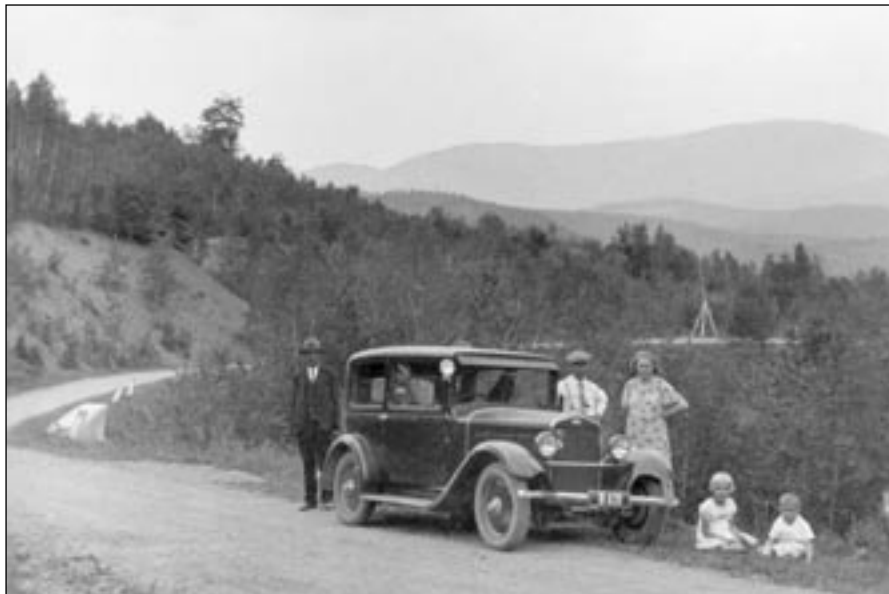
Z rodinného archivu

vozy venkovanků přijíždějících do města na trhy, spousty venkovanků v kožíších z ovcí a mezi tím ruchem vozidla motorová, cyklisti, židé s kárami a vozíky, venkovani s fůrami dříví, co jen bylo pod námi dole života! Pod naším bytem šla ulice k tržišti, takže dům Latorica byl průchodným i průjezdným.