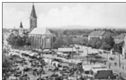
Masarykovo náměstí - místo jarmarků a trhů. Vpravo budova městské radnice (s věžičkou)