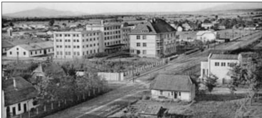
Úřad pro nákup tabáku