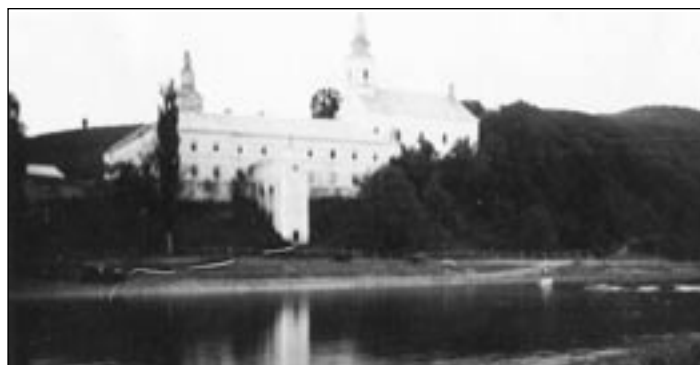
Oblíbené byly vycházky podél Latorice ke klášteru Vasiliánů