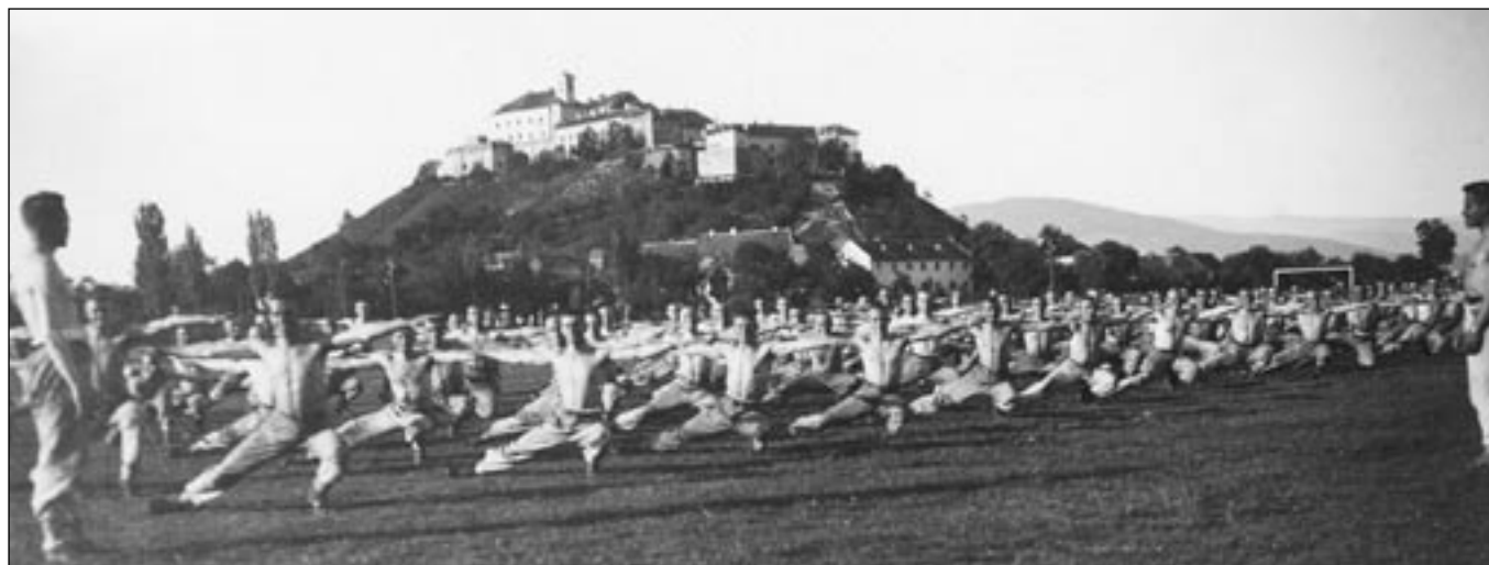
Hodina vojenské tělovýchovy pod mukačevským hradem Palanok, září 1934