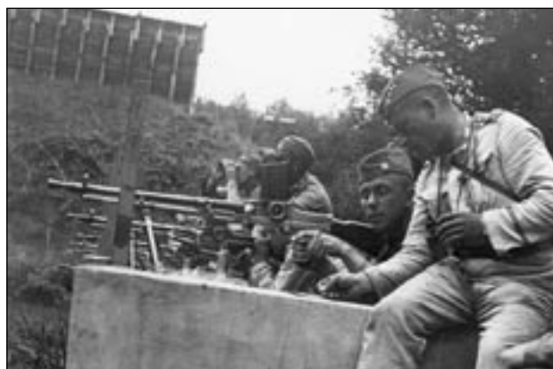
Ostré střelby z vynikajících čs. lehkých kulometů ZB vz. 26, září 1934