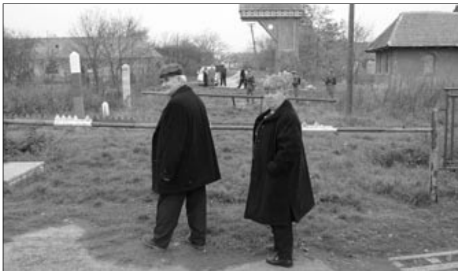
Záběr z filmu Hranice

Rodiče nemohli na svatbu svých dětí, na křtiny svých vnuků a vnuček, děti nemohly na pohřby svých rodičů. Představte si, že ukazujete svým rodičům jejich vnuka přes plot, který by vás, kdybyste se ho jen dotkli, zabil.