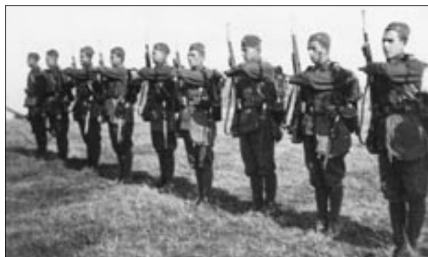
Pěší družstvo v plné polní se hlásí po návratu z cvičení veliteli, říjen 1934