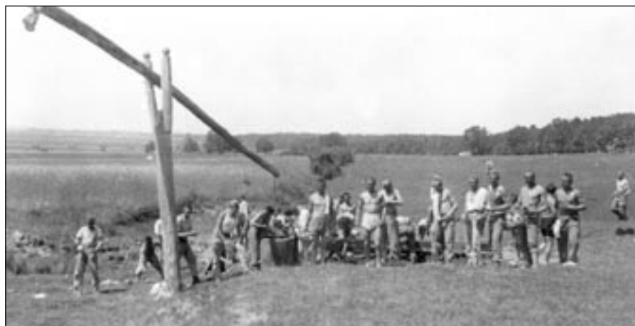
Osvěžení u vahadlové pumpy v horkém dni na cvičení v okolí Užhorodu, červen 1935.