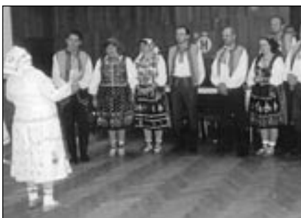
Rusínský soubor Skejušan slavil 15. května 2010 v Chomutově dvacáté výročí vzniku

Rusínský soubor Skejušan by si mohl do zkušebny pověsit mapu a zapichovat si praporky na místa, kde všude už vystoupil. Za dvacet let existence by už na ní byla celá republika poseta vlajčkami. Některá města a vesnice by asi potřebovala důkladně nastavit, aby se na ně všechna znamení vešla. Na řadu míst totiž soubor jezdí opakovaně. Také v uplynulém roce má Skejušan ve svém souborovém „zeměpise“ dlouhou řadu lokalit – od svého sídelního Chomutova až třeba po Troskovic, kde účinkoval na Zaplavských slavnostech, či slovenskou Kamianku. Několikrát se představil v Praze, např. na mikulášském večírku SPPR a Klubu Rusínů a na národním krojovaném plese v hotelu Praha. Hrál a zpíval v Červeném Hrádku na Balkánských slavnostech, na folklorním plese v Chebu, na festivalu ve Strážnici, na národnostních akcích, koncertech a dalších slavnostech v Chomutově,