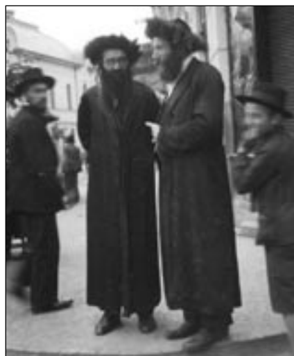
Na mladé vojáky – chlapce z Čech – působili mukačevští Židé starozákonním dojmem