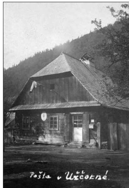
Budova pošty v Ustí Čorné

Mírový život a rozvoj Ustí Čorné a okolí byly po r. 1939 vystřídány válečným obdobím. I když se většina Němců z Poteresví neztotožnila s fašistickým režimem, část z nich vstoupila do řad ozbrojených sil Třetí říše. V průběhu 2. světové