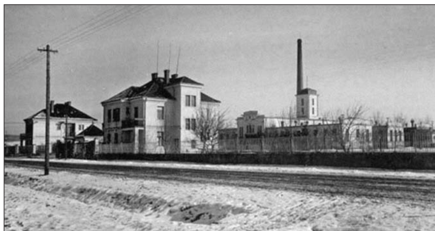
Masokombinát na Kapušanské

Významnou součástí školy bylo moderní hygienické zařízení a dvůr s hřištěm. V prvním roce vznikla jednotřídka pro 30 dětí, postupně se