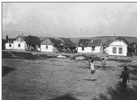
Cikánská vesnice po založení školy

počet tříd a žáků rozšiřoval. Dopoledne se vyučovaly základní předměty, odpoledne předměty doplňkové, jako např. tělocvik, hra na housle, zpěv. Nebylo výjimkou, že na některé předměty chodili i dospělí, a třeba i večer. Specifikou byla půlhodinová doba jedné vyučovací hodiny.