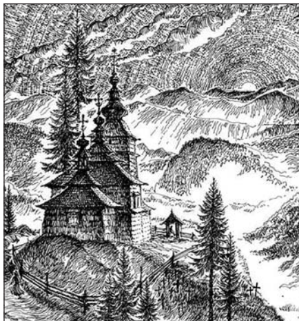
Lemkovský kostelík. Grafika Anny Karpan

Každý rok jsme rozdělovali částku zhruba třiceti až čtyřiceti tisíc korun, což je tu cena za jednu lehčí operaci. Peníze jsme předávali buď přímo potřebným na základě dlouhodobých důvěrných vztahů, nebo pomocí ústředí místní církve, o rozdělení dále rozhodovala bratrská rada SEKB v Zakarpátí. Rovněž nám pomohli důvěryhodní lidé z místních sborů. Výhodou je institut diakonů sloužících ve zdejších společenstvích a oblastech, kteří nejlépe znají potřeby