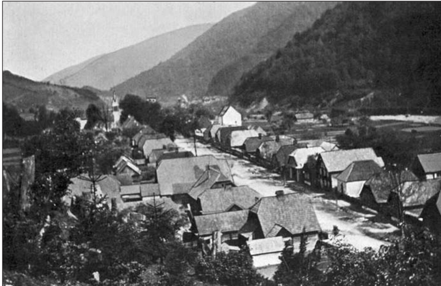
Ust' Čorna – celkový pohled