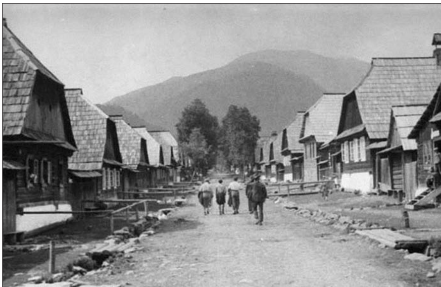
Dělníci jdou do práce. Hlavní ulice v Německé Mokré

vystupuje skupina malebných dřevěných chaloupek, kukuřičná pole, řady slunečnic. U Ternova se údolí znenáhla zužuje. Podél řeky vedla na tomto úseku do konce 90. let minulého století úzkokolejná lesní železnice, dnes však bohužel již není v provozu. Údolí řeky Teresvy rozděluje horské útvary rozsáhlých polonin Krásná a Svidovec, které jsou i v současnosti pokryty