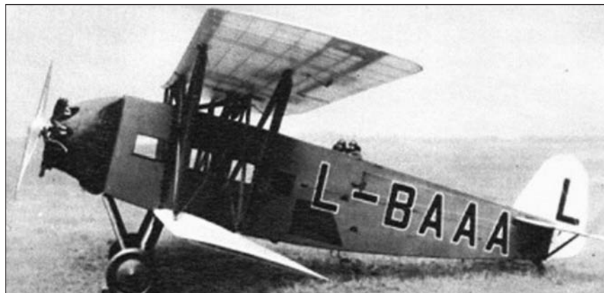
Aero A 23 pro 6 cestujících a poštu létající do Užhorodu

Velikost jatek i chladíren se stanovila s ohledem na budoucí rozvoj města tak, aby v nejbližším desetiletí nebylo nutno jatka rozšiřovat a přesto byl zachován prostor pro případné rozšíření. Pro obchodní účely bylo postaveno přílehlé moderní obchodní tržiště (plocha starého tržiště byla uvolněna pro zvýhodněnou bytovou výstavbu). Celkové náklady činily 7 mil. Kč. Na stavbu poskytlo Ministerstvo pro zásobování lidu výhodnou půjčku ve výši 1 mil. Kč a ministerstvo zemědělství dotaci ve výši 70.000 Kč.