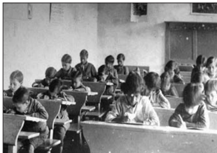
První žáci cikánské školy